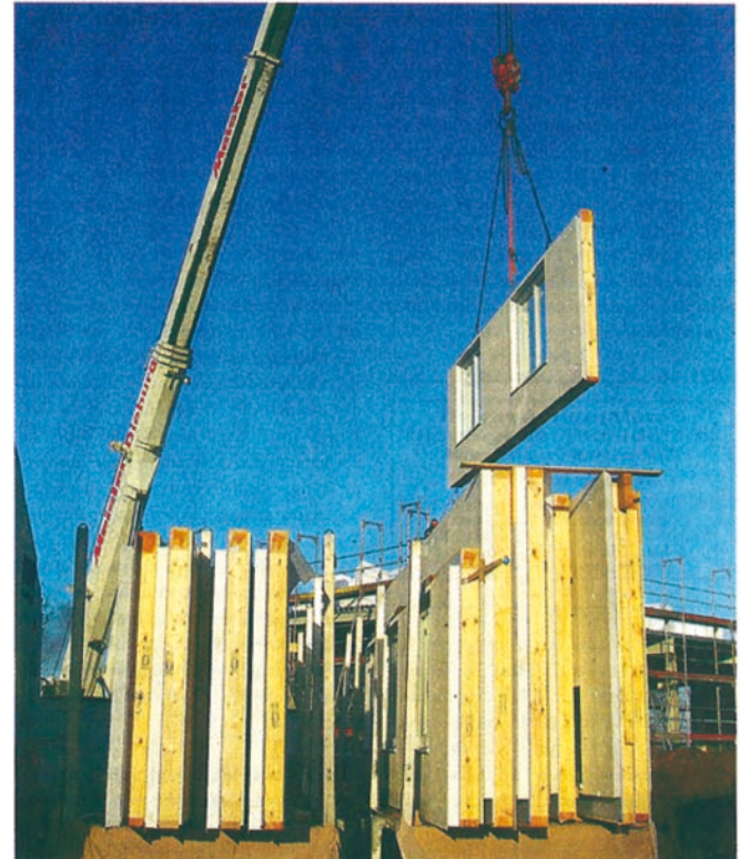
Der Aufbau geht dann schnell

Eine intelligente Planung, die viele kleine technische Mosaiksteinchen zugunsten einer autarken Energieversorgung zu einem nachhaltigen Ganzen vereint, erfordert einen höheren planerischen und damit finan-